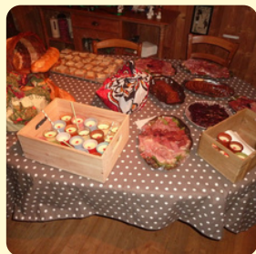
Repas forézien livré au gîte

Gestion libre Demi-pension Pension complète Cuisine locale et traditionnelle