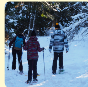
Balade en raquettes