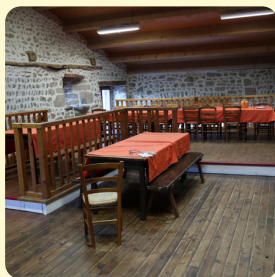
3 salles 20 à 30 personnes

Plusieurs lieux pour travailler dans un cadre d'exception: une ferme forézienne typique. Cuisine et point café à disposition.