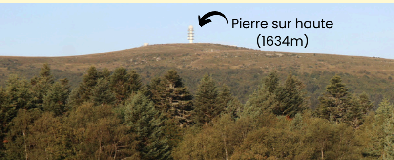
↖ Pierre sur haute (1634m)

Hébergement Demi-pension Pension complète Animations et randonnées