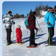
Raquettes à neige