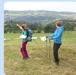
Les randonnées accompagnées

Toute l'année randonnées accompagnées par une guide locale. Programme sur mesure en fonction de votre niveau et de vos envies. Faune, flore, géologie, agriculture, patrimoine forézien.