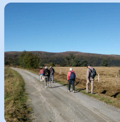
Les Hautes chaumes du Forez

Gîte situé sur les variantes du GR3 bis et idéal pour randonner en étoile. Départs de randonnées sur les hautes chaumes du Forez à 10 min en voiture.