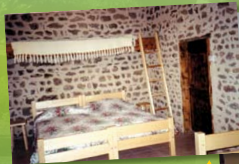
7 chambres de 2 à 6 lits équipées de sanitaires privatifs ▲