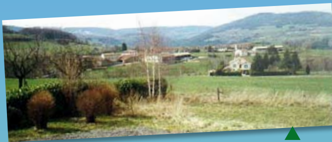
Hameau de Grandris

Visitez notre exploitation agricole Tous les jours sur réservation : 04 77 76 81 33