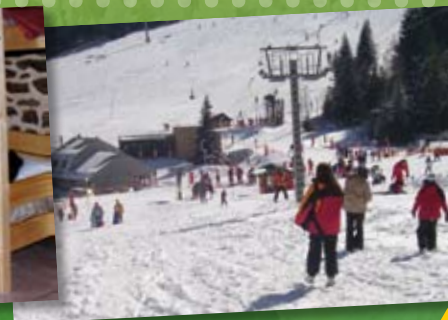
Station de ski alpin et nordique à 15 mn ▲