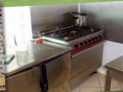
Cuisine professionnelle ▲