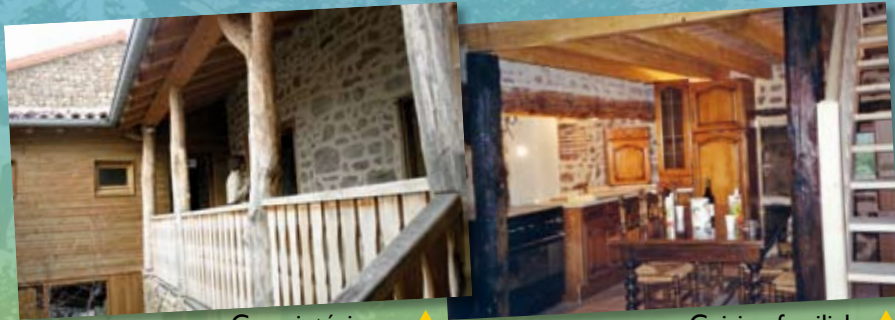
Cour intérieure ▲

1 gîte de séjour 30 lits (Possibilité 1 gîte 18 lits + 1 gîte 12 lits)